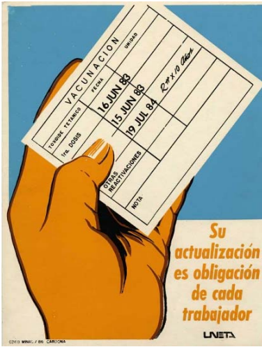
Incitación directa al cumplimiento