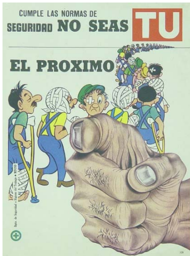
Tú y Nosotros